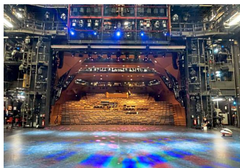
Ein Blick von der Bühne des Staatstheaters.

Die Schauspieler kommen und nutzen die Zeit, um sich auf ihren nächsten Auftritt vorzubereiten. Der Regisseur gibt die letzten Anweisungen und den Schauspielern die letzten Ratschläge. Ab 19 Uhr wird es ernst. Das Publikum beginnt allmählich das Theater zu füllen. Aber hinter den Kulissen steckt noch viel Arbeit. Die Künstler werden in ihre aufwendig gemachten Kostüme gekleidet und die Techniker sorgen dafür, dass alles bereit ist. Dann geht es endlich