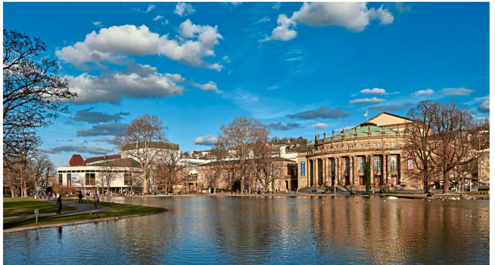
Das Staatstheater in Stuttgart hinter dem Eckensee mitten im Stadtzentrum.