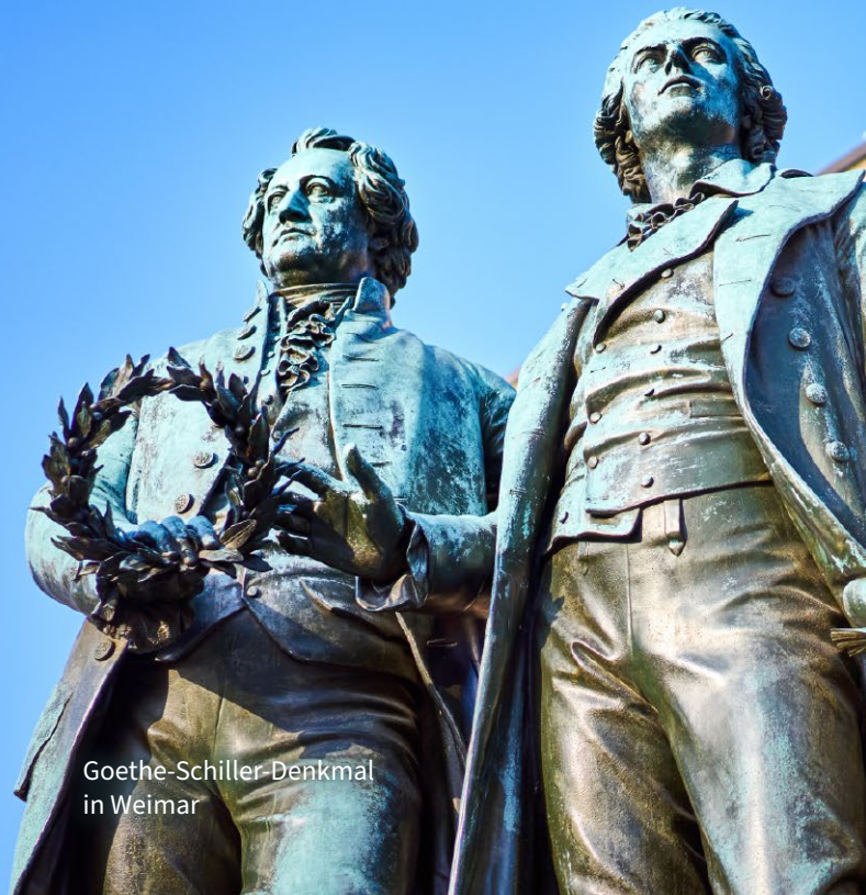
Goethe-Schiller-Denkmal in Weimar