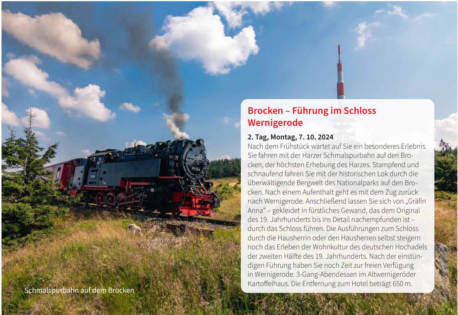
Schmalspurbahn auf dem Brocken