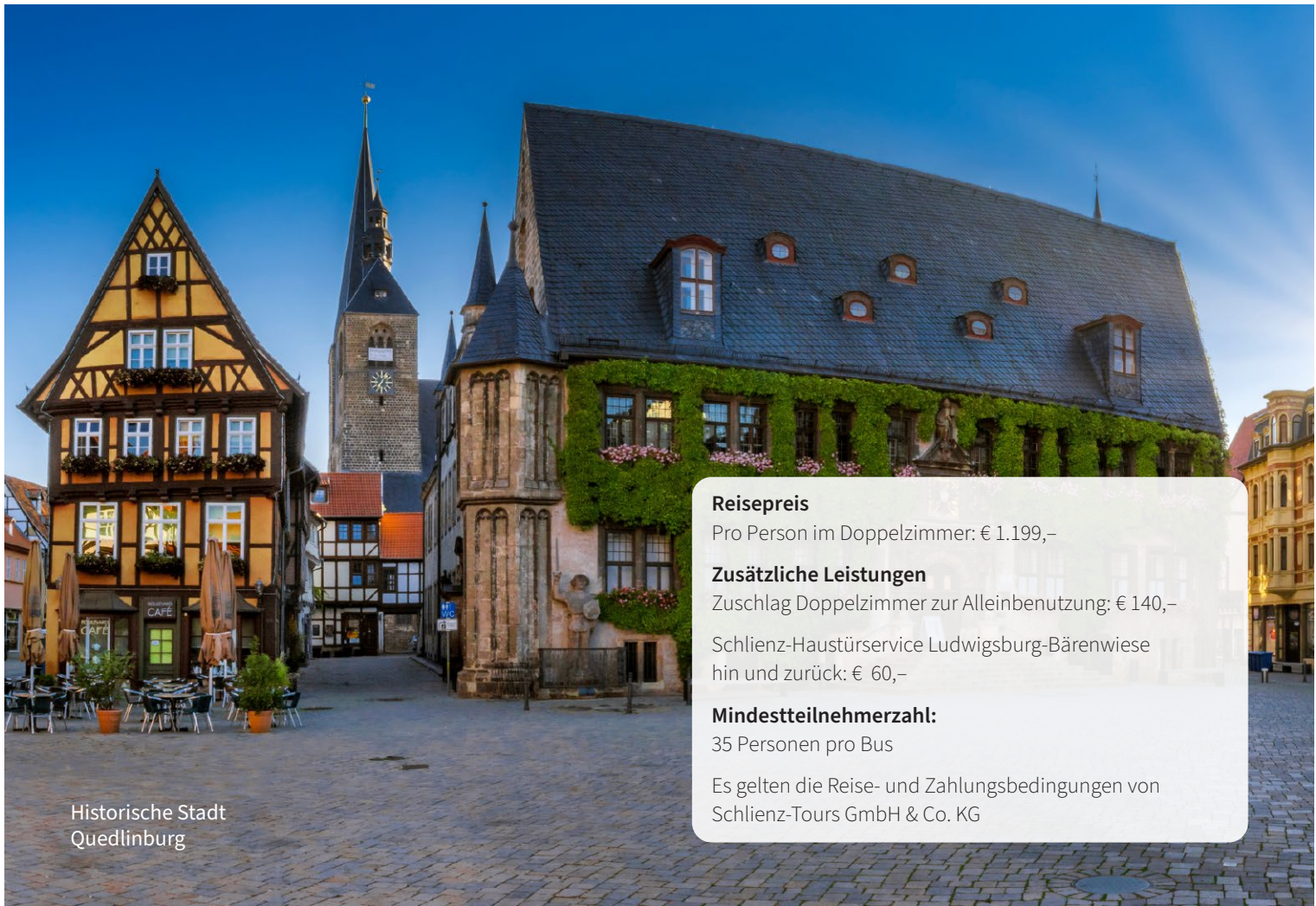
Historische Stadt Quedlinburg