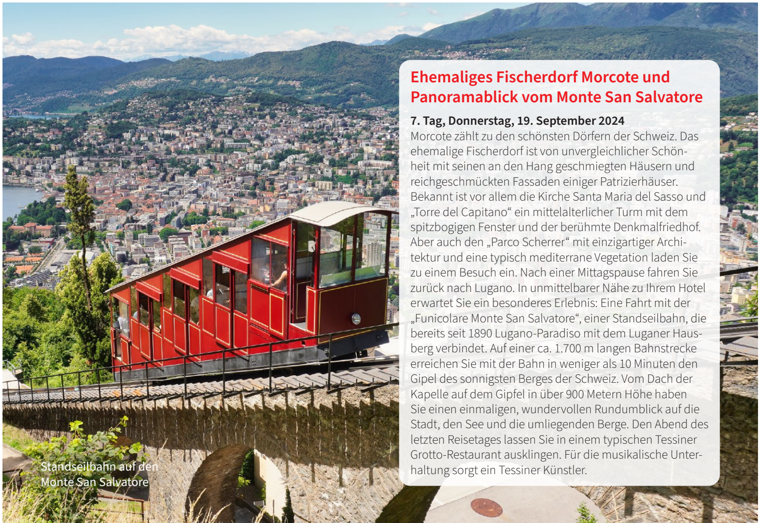
Standseilbahn auf den Monte San Salvatore