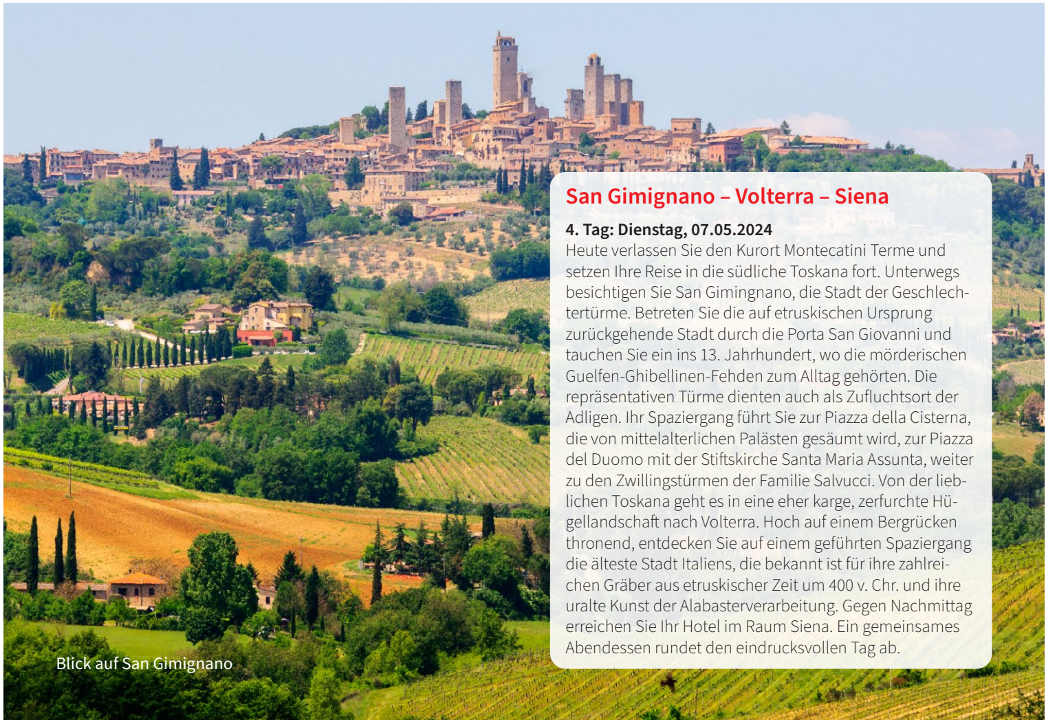
Blick auf San Gimignano