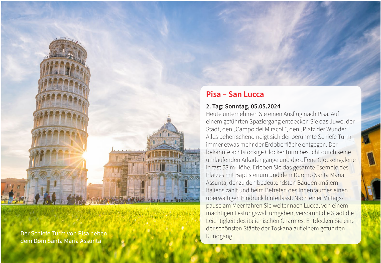
Der Schiefe Turm von Pisa neben dem Dom Santa Maria Assunta