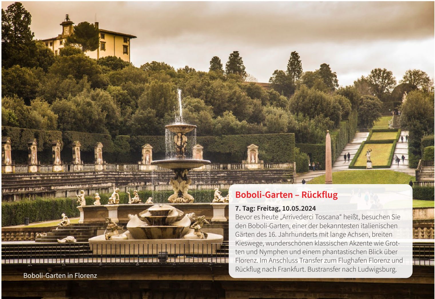
Boboli-Garten in Florenz