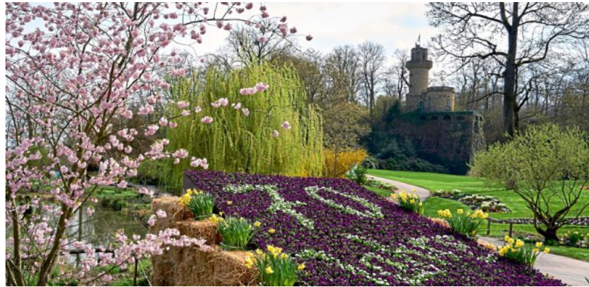
Insgesamt wurden 128.000 Blumenzwiebeln gesetzt und circa 1600 Quadratmeter Blumenwiesenflächen angesät.

Als Dauergartenschau und Märchengarten im Ludwigsburger Schlosspark müssen aber auch gartendenkmalpflegerische Zielstellungen berücksichtigt werden. Welche Flächen sollen als Wiese gepflegt werden, welche Bereiche als repräsentative Rasenfläche? Wie weit können Flächen für den Artenschutz optimiert werden? Für das Jubiläumsjahr wurden daher bereits im Herbst 2023 von den Gärtnern des Blühenden Barocks an mehreren Stellen farbenfrohe, mehrjährige Blumenwiesen mit Frühjahrsblumenzwiebeln angelegt. Die Blumenwiesen sollen sich an den angelegten Stellen langjährig entwickeln und dem Gestaltungsanspruch der Gartenanlage dauerhaft entsprechen. Ziel ist es auch, die in den vergangenen Jahren jeweils nur für den Saisonstart angelegte Frühjahrsbroderie auf den Kiesfeld vor dem Schloss, welche nach dem Verblühen der Blumenzwiebeln entsorgt