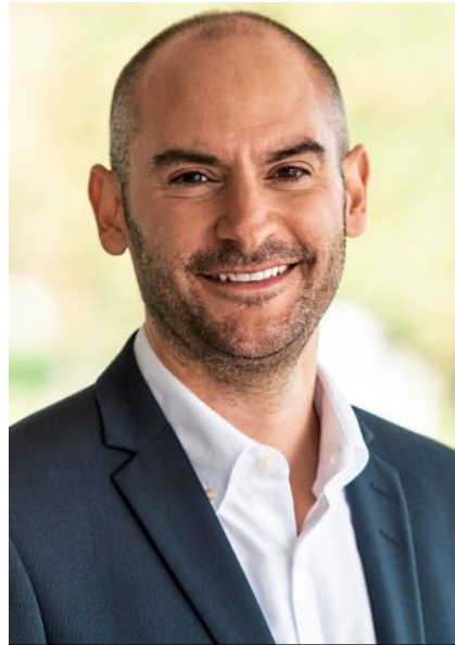
Dr. Danyal Bayaz Minister für Finanzen Baden-Württemberg

Insofern hat das Blühende Barock für viele eine emotionale Bedeutung und ebenso etwas Identitätsstiftendes. Und das keineswegs nur für Familien, sondern auch für Liebhaber dieser wunderbaren Schlossanlage. Zusammen mit dem Residenz-