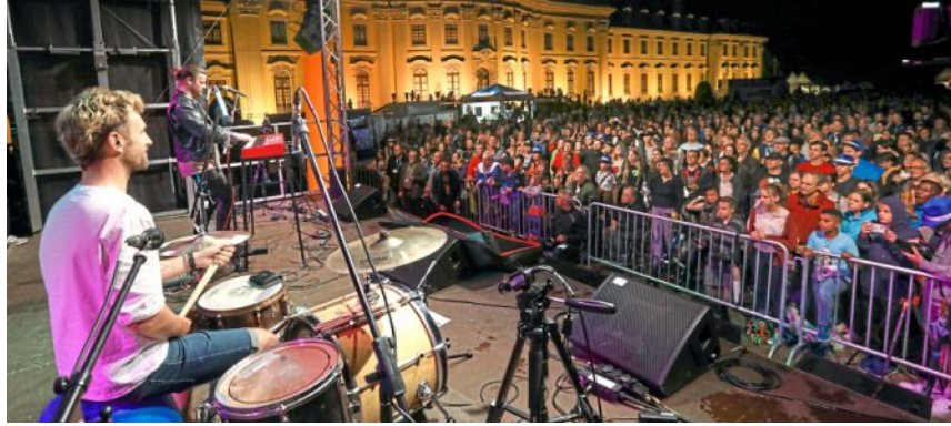
Beranger ist auch dieses Jahr beim großen Jubiläumskonzert des Straßenmusikfestivals im Blühenden Barock dabei.

Am diesjährigen Pfingstweekende, vom 17. bis 19. Mai, gehört Ludwigsburg wieder ganz den Straßenmusikern und ihren Fans. Damit findet eine besondere Beziehung ihre Fortsetzung. Denn die Qualität des Festivals hat sich in den Jahren herumgesprochen – sowohl bei den Musikern wie auch den Besuchern aus nah und fern.