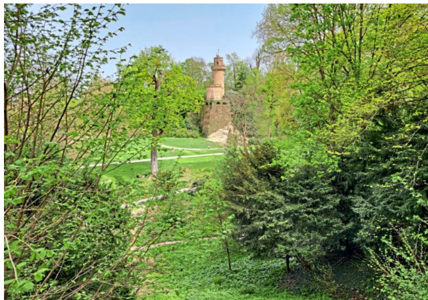
Blick über das wildromantische Tal der Vogelstimmen zur Emichsburg.

Es wird lange dauern, bis sie so groß sind wie ihre Vorgänger. Aber Fähnle und sein Team werden alles dafür tun, dass sie sich gut entwickeln können. Die Arbeit wird ihnen nicht ausgehen, so viel ist sicher. (ivo)