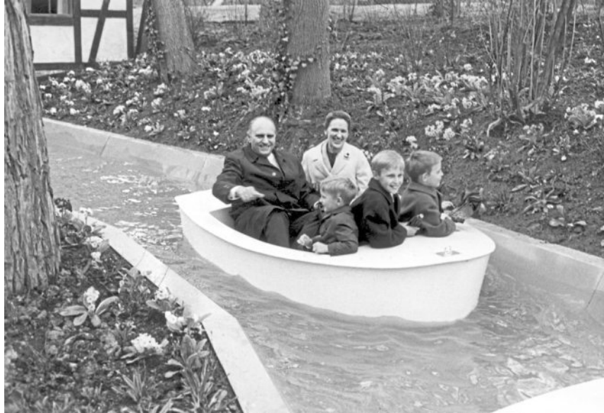
Im April 1969 besteigt der baden-württembergische Finanzminister Robert Gleichauf mit seiner Familie die beliebten „Boote“ im Märchengarten. Das „Hexenhäusle“ gehört zu den Attraktionen, die bis heute begeistern.

Das liebevolle Konzept und die Begeisterung der kleinen und großen Besucher überzeugten ihn. „Der Märchengarten selbst zeigte das hübscheste Dornröschenschloss, das man sich denken kann. Manche der lustigen Einfälle gingen mir zu weit, zum Beispiel rot-, grün-, gelb- und blau gefärbte lebende Tauben,