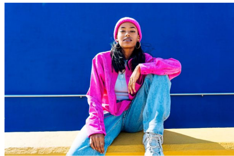
Wer ein leuchtendes Pink tragen möchte, ohne das die Kombination zu sehr knallt, trägt die Farbe am besten zu helleren Tönen.

„Wenn das ein bisschen abgeschwächt werden soll, dann könnte Pink zum Beispiel mit einer beigefarbenen Chino oder zu sandfarbenen Tönen, etwa dem sandfarbenen Anzug, getragen werden. Also zu hellen Tönen. Damit kann man das total gut abmildern.“ Ebenfalls gut passt Pink zu Dunkelblau. Probieren Sie etwa zur dunkelblauen Stoffhose einfach mal ein pinkes Hemd aus. (dpa/tmn)