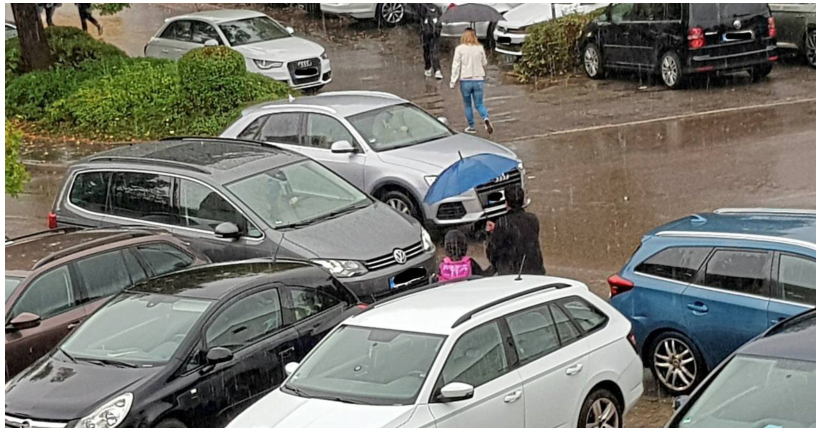
Viele Autos sorgen vor der Waldschule Bissingen regelmäßig für ein Verkehrschaos.