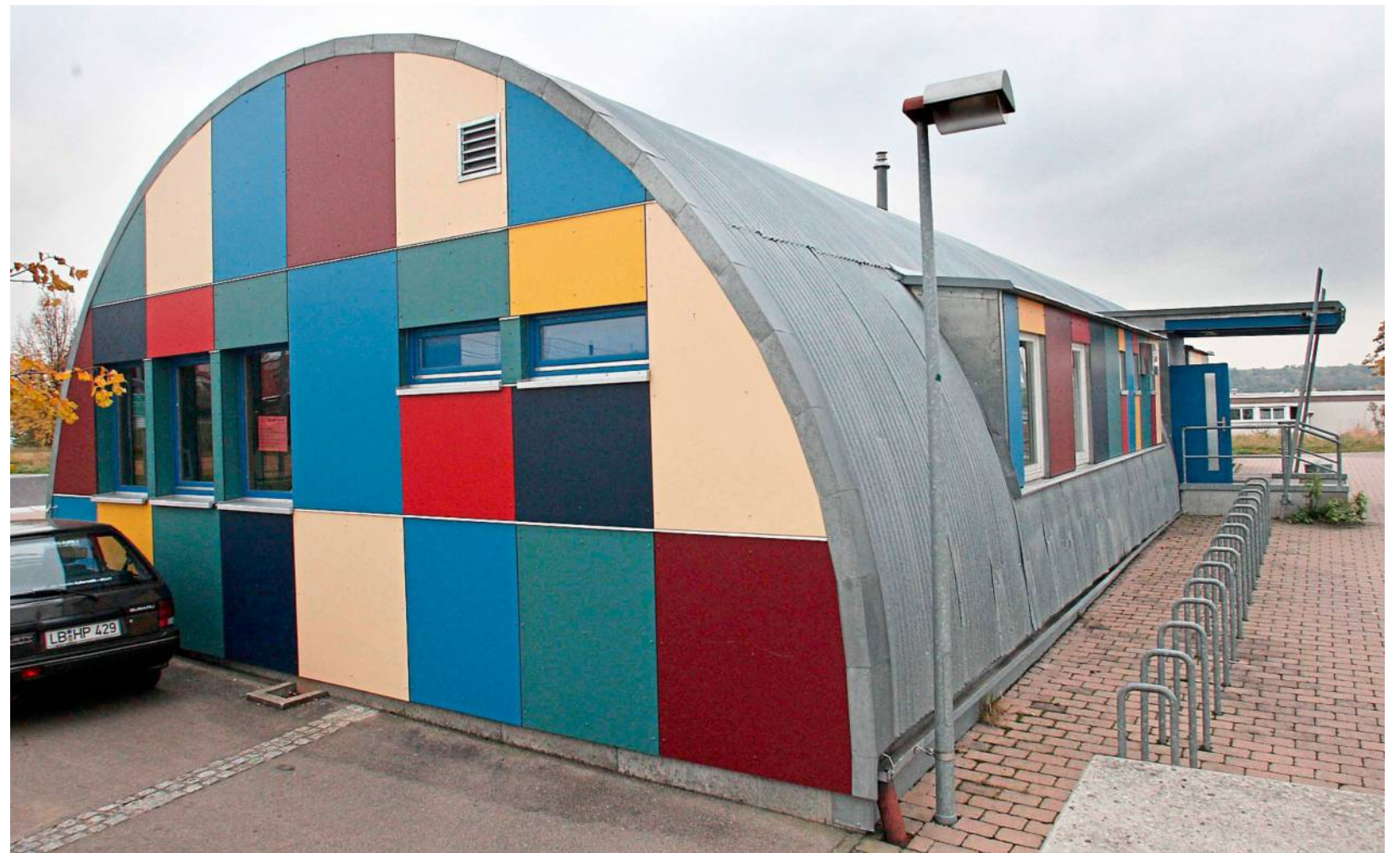
Das Jugendhaus Tamm.

■ Für Schulen und Lehrer: Kontakt: Markus Moog vom IZOP-Institut (mm@izop.de). ■ Für Unternehmen: Informationen zur Förderung finden Sie unter www.lkz.de/business-abos . (red)