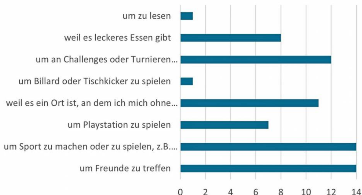
Eine Umfrage unter den Schülerinnen und Schülern zeigt, warum Kinder das Jugendhaus besuchen.