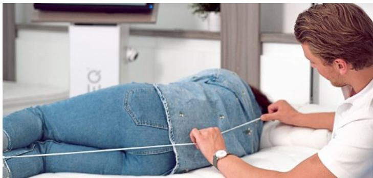
Unverbindlich und kostenlos: Die Analyse am Liege-Simulator beim Schlafexperten Anton Heling in Ludwigsburg.

Von der Medizin bis zum Wetter sind computergestützte Prognosemodelle der goldene Standard. Beim Thema Schlaf vertrauen Experten dem Liege-Simulator.