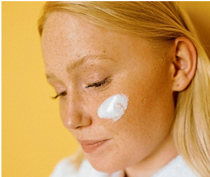
Longevity für die Haut beginnt mit einem hochwertigen Sonnenschutz.

Ein bewusster Umgang mit der Sommersonne, gepaart mit etwas Pflege, lässt die warmen Monate zu einer unbeschwerten Zeit werden. Gefragt sind dazu Formulierungen, die einen hohen Lichtschutzfaktor bieten und unbe-