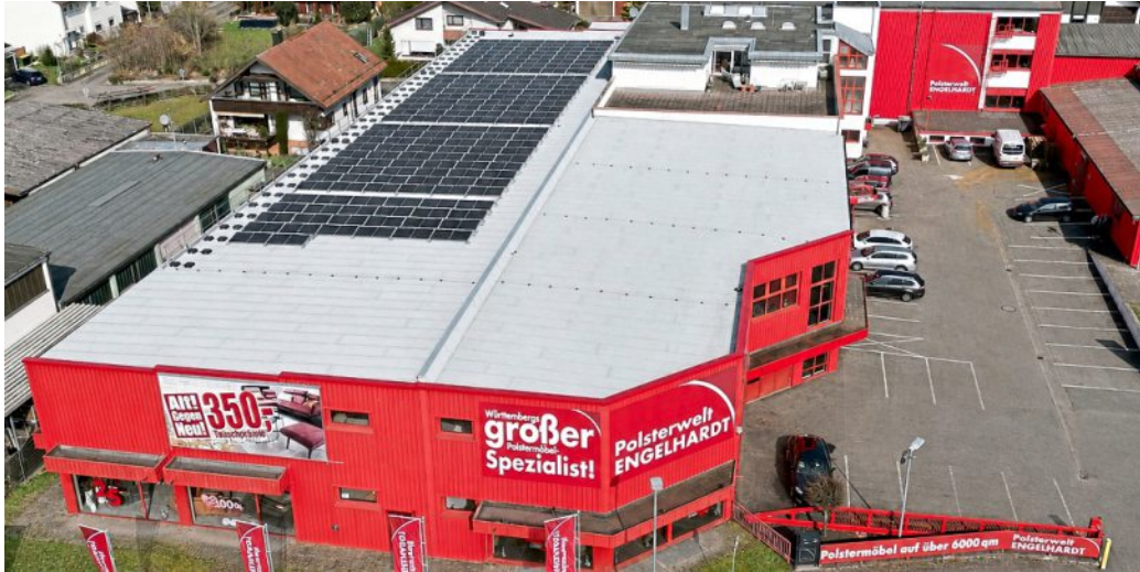
Bei Polsterwelt Engelhardt in Ingersheim findet man eine enorme Vielfalt an verschiedenen Wohnlandschaften, Betten und Sofas.