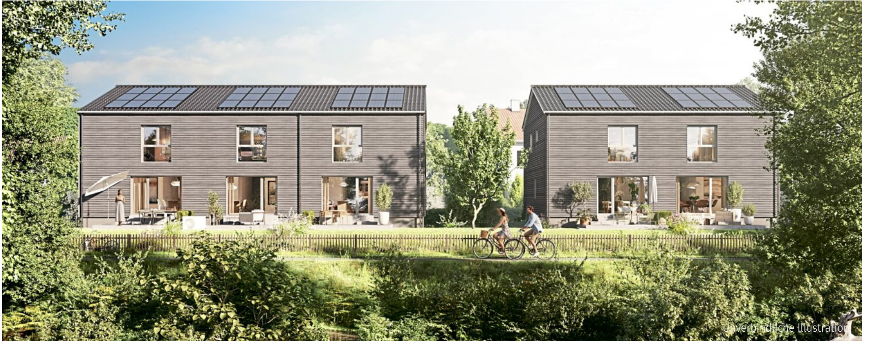
Lebensfreude an der Enz. Fünf nachhaltige Reihen- und Doppelhäuser in Bietigheim-Bissingen.