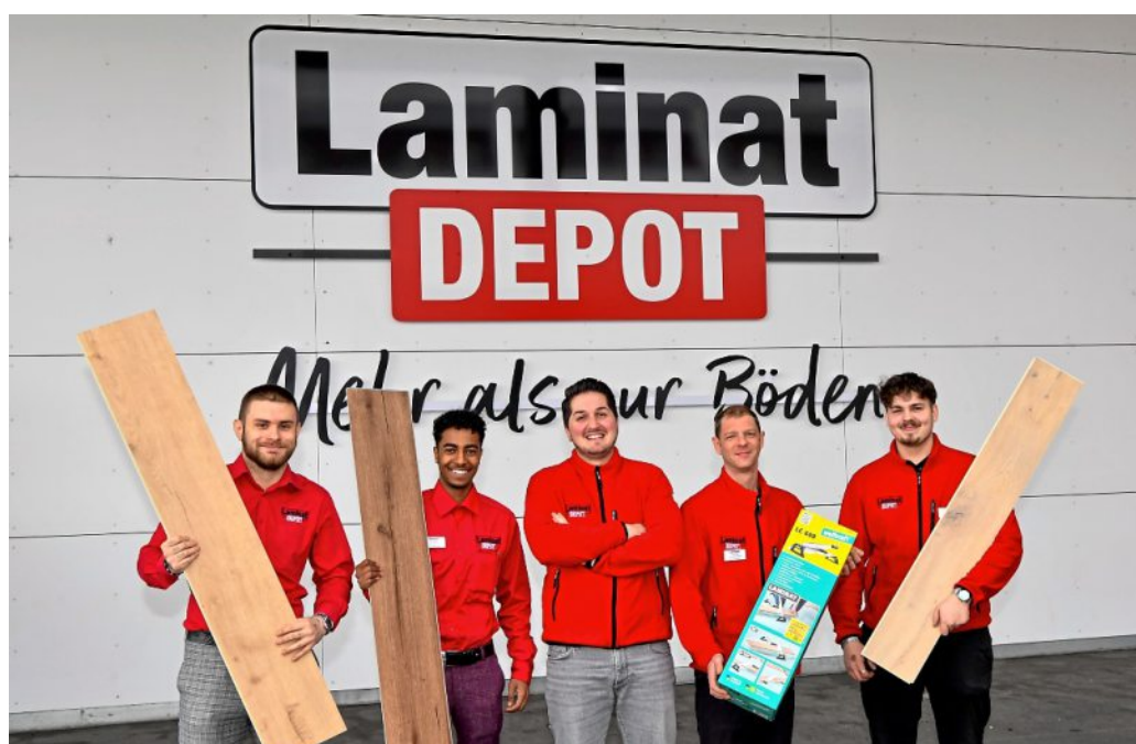
Das Team von LaminatDEPOT hilft bei der Beratung und Auswahl von hochwertigen Böden.

Info: LaminatDEPOT Bietigheim Kirchheimer Straße 4 74321 Bietigheim-Bissingen laminatdepot.de