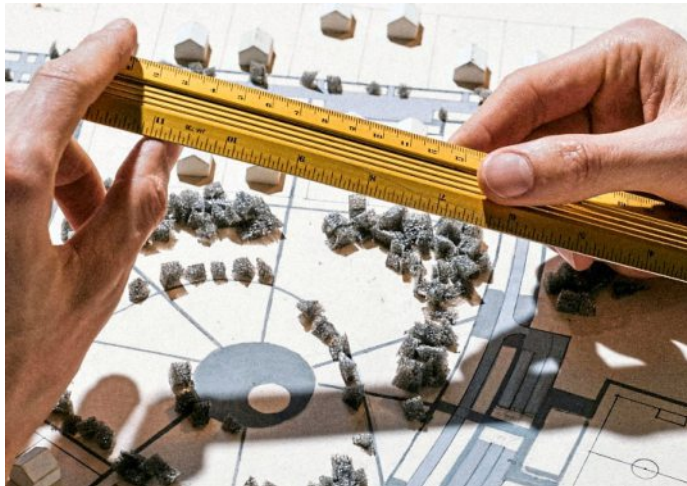
Gemeinsam bauen schweißt zusammen und spart Geld.

Allerdings sind auch hier klare Absprachen zwischen den beteiligten Bauherren notwendig, um die Kosten im Rahmen zu halten.