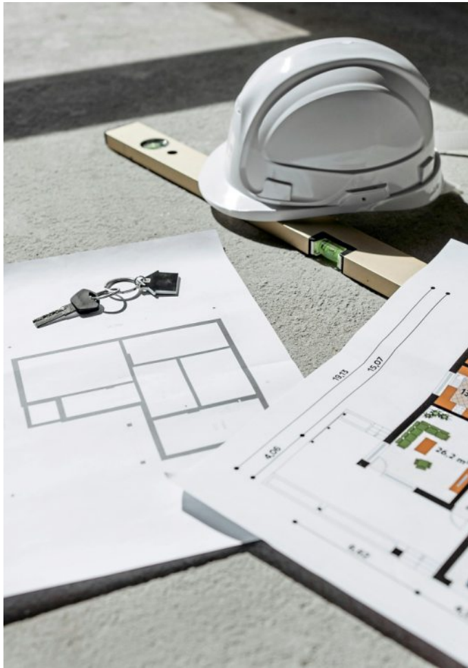
Schon an alle Versicherungen gedacht?

Wird das Nachbargrundstück in Mitleidenschaft gezogen oder jemand durch herabfallende Bauteile verletzt, kann es zu Schadenersatzforderungen kommen. Bei berechtigten Forderungen leistet die Bauherren-Haftpflichtversicherung, unberechtigte wehrt sie ab. „Sofern Bauvorhaben bereits über die Privathaftpflichtversicherung abgesichert sind, sollte unbedingt geprüft werden, ob die dort vereinbarte Versicherungssumme zur tatsächlichen Bausumme passt“, rät