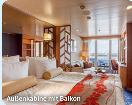
Außenkabine mit Balkon