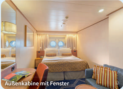
Außenkabine mit Fenster