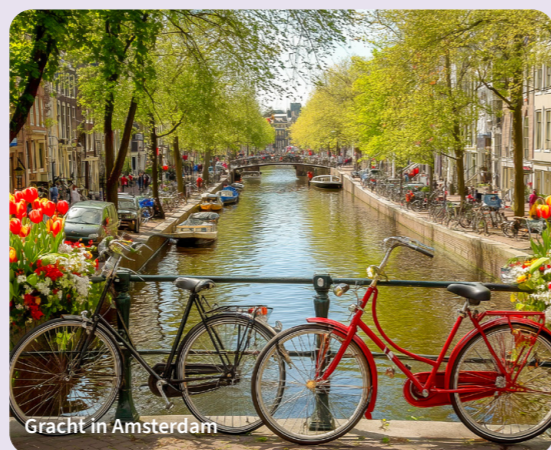
Gracht in Amsterdam

Erleben Sie die zauberhafte Schönheit der Niederlande in ihrer vollen Blüte! Diese Frühlingsreise führt Sie zu den berühmtesten Naturwundern, einzigartigen Architektur-Highlights und beeindruckenden Ingenieurskunstwerken des Landes. Von den farbenprächtigen Tulpenfeldern des Keukenhofs über die faszinierende Geschichte der Deltawerke bis hin zu den innovativen Floating Homes in Amsterdam – entdecken Sie ein Land, das traditionelles Handwerk mit zukunftsweisender Technik vereint. Lassen Sie sich verzaubern von der Schönheit der Polderlandschaften und genießen Sie den einzigartigen Charme niederländischer Küstenorte. Diese Reise verspricht unvergessliche Erlebnisse und einmalige Ausblicke auf unser Nachbarland, die Niederlande.