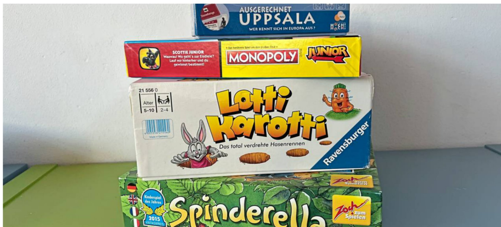
Das sind die beliebtesten Spiele in der Bücherei Erdmannhausen.